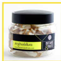
DRYBUDDHAS Mano de buda deshidratada REF: 1403 45g / 30 unidades (aprox)