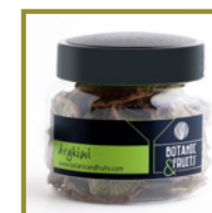
DRYKIWI Kiwi deshidratado REF: 1414 70g / 50 unidades (aprox)