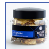
DRYPINHA Piña deshidratada REF: 1412 55g / 30 unidades (aprox)