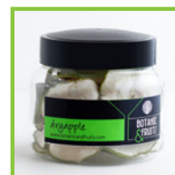
DRYAPPLE Manzana verde deshidratada REF: 1409 45g / 20 unidades (aprox)