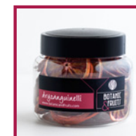
DRYSANGUINELLI Naranja sanguina deshidratada REF: 1410 70g / 35 unidades (aprox)