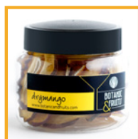
DRYMANGO Mango deshidratado REF: 1405 55g / 20 unidades (aprox) Dosis recomendadas: 20