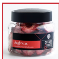
DRYFRAISE Fresa deshidratada REF: 1408 40g / 100 unidades (aprox)