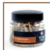
DRYLICORISSE Regaliz de palo deshidratado REF: 1413 70g / 90 unidades (aprox)