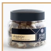
DRYGINJER Jengibre deshidratado REF: 1407 40g / 45 unidades (aprox) Dosis recomendadas: 45