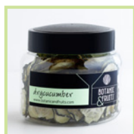
DRYCUCUMBER Pepino deshidratado REF: 1406 25g / 75 unidades (aprox)