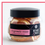
DRYPOMELOROSSO Pomelo deshidratado REF: 1401 55g / 25 unidades (aprox)