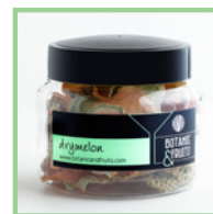
DRYMELON Melón deshidratado REF: 1411 50g / 40 unidades (aprox)