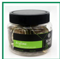
DRYLIME Lima deshidratada REF: 1418 55g / 40 unidades (aprox)