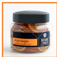
DRYORANGEN Naranja deshidratada REF: 1404 70g / 35 unidades (aprox)