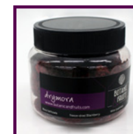
DRYMORA Mora liofilizada REF: 1416 45g / 75 unidades (aprox)