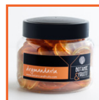
DRYMANDARIN Mandarina deshidratada REF: 1415 55g / 55 unidades (aprox)